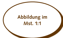
50.470 Oval klein > 27x17x2 mm > 88 Stk. pro Gummischablone