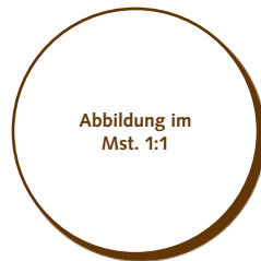
50.500 Kreis 30mm > Ø30x2 mm > 56 Stk. pro Gummischablone