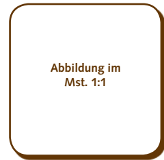
50.520 Quadrat abgerundet > 30x30x2 mm > 56 Stk. pro Gummischablone

Schoko-Aufleger mit unserer Single Origin Grand Cru Couverturen Finca La Amistad 36% und 60% aus Costa Rica und Dominicana 36% weiss.