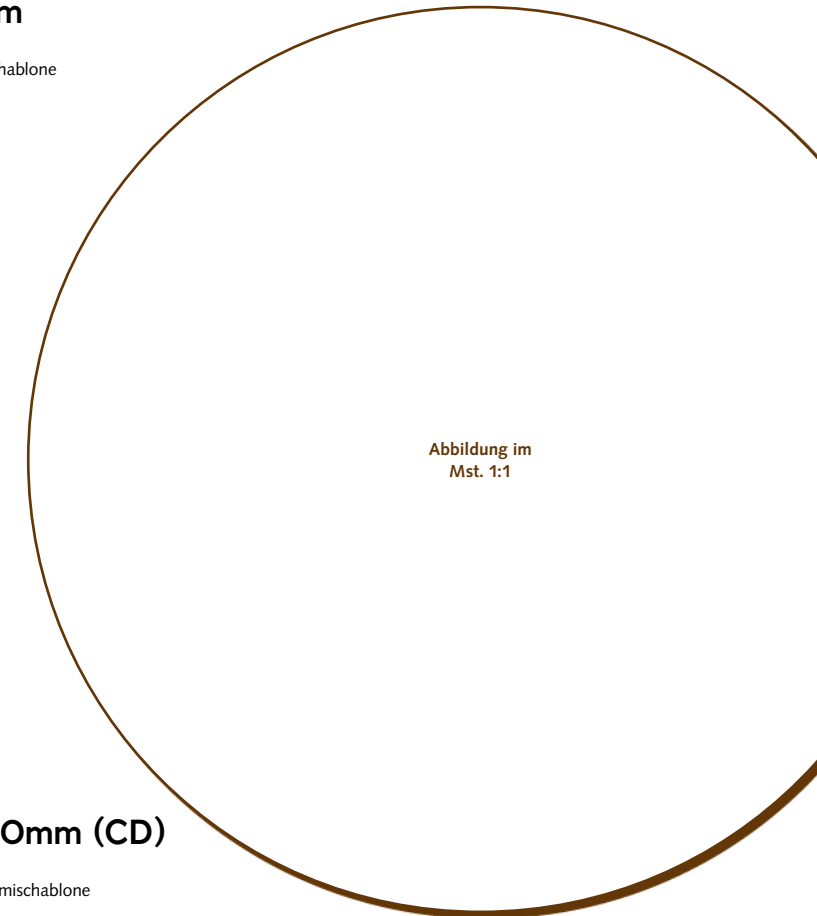
50.820 Kreis 120mm (CD) > Ø120x5 mm > 4 Stk. pro Gummischablone