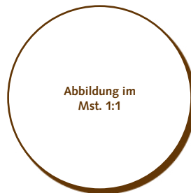
50.560 Kreis 35mm > Ø35x2 mm > 42 Stk. pro Gummischablone