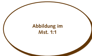
50.420 Oval gross > 40x25x2 mm > 48 Stk. pro Gummischablone