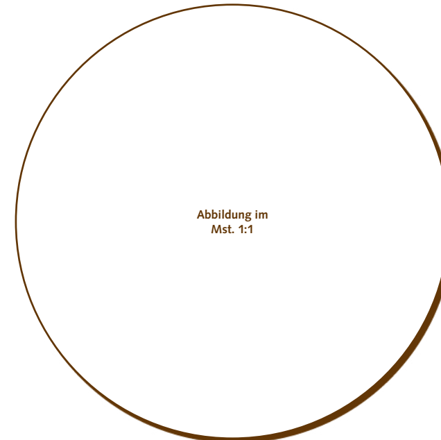
50.230 Kreis 83mm > Ø83x2 mm > 6 Stk. pro Gummischablone