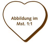
50.290 Herz > 22x20x2 mm > 56 Stk. pro Gummischablone