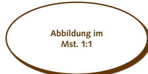
50.490 Oval mittel > 37x19x2 mm > 60 Stk. pro Gummischablone