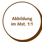
50.550 Kreis 20mm > Ø20x2 mm > 99 Stk. pro Gummischablone