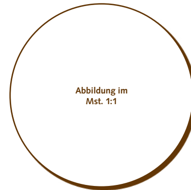
50.320 Kreis 48mm > Ø48x2 mm > 23 Stk. pro Gummischablone