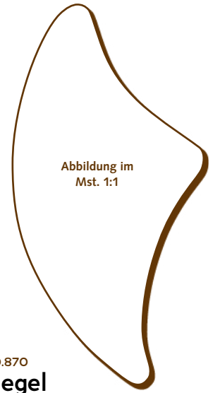
50.870 Segel > 35x73x2 mm > 24 Stk. pro Gummischablone