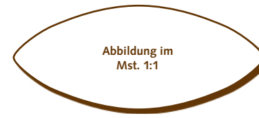
50.400 Elipse > 48x20x2 mm > 40 Stk. pro Gummischablone