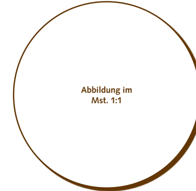
50.940 Kreis 50mm > Ø50x2 mm > 20 Stk. pro Gummischablone